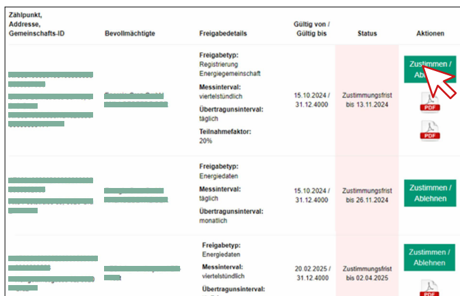
Abbildung 7: Serviceportal – Meine Datenfreigaben – Aktion zustimmen

In der tabellarischen Ansicht unter der Spalte „ Aktionen “ (siehe Abbildung 7) können Sie durch Klick auf die Buttons „ Zustimmen “ oder „ Ablehnen “ zu den entsprechenden Unterfenstern gelangen, um Ihre Datenfreigaben zu bearbeiten. Ihre Bestätigung bzw. Zustimmung ist erforderlich, damit der Prozess erfolgreich abgeschlossen werden kann. Zudem können Sie alle zugehörigen Vertragsunterlagen jederzeit als PDF unter der Spalte „ Aktionen “ herunterladen.