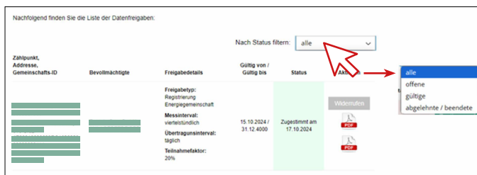
Abbildung 6: Serviceportal – Meine Datenfreigaben – tabellarische Ansicht bzw. Filter Status

In der tabellarischen Ansicht Ihrer Datenfreigaben (siehe Abbildung 6) können Sie Ihre Einträge ganz einfach über die Filterfunktion oben rechts sortieren und anzeigen lassen.